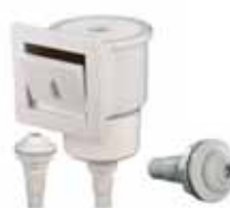
Skimmer und Einlaufdüsen