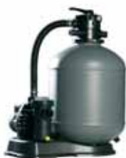
Filteranlage HP Serie